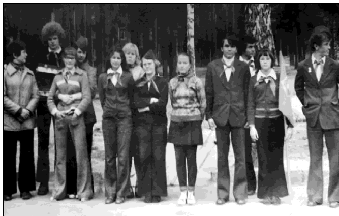
Лӱбмью, инструктивнӱй лагер.

структивнӱ лагер, кӱн факультетысь коймӱд курса студентьяс челядялисны-пионералисны да ворсӱдисны асьнысӱ. Тайӱ вӱлі зӱв коланатор, ӱд унаӱн ми костысь челядьдырйинис ӱз вӱвны пионерлагерьясын, торья нин ми, сиктсаяс. Путӱвкаяс сетлисны леспромхозын уджалысьяслӱн челядьлы, а совхозсаяслы ӱз вичмыв. Кӱнкӱ, гашкӱ, и мӱд ногӱн вӱлі, ӱг тӱд. Книгаясысь, «Пионерская правда» газетысь, «Пионер» да «Костӱр» журнальясысь пионерскӱй лагерьясын интереснӱй олӱм йылысь лыддигӱн пыр вӱлі ӱкота веськавлыны сӱтчӱ. Тайӱ кӱсйӱмысь збыльмис Университетын велӱдчигӱн. Мед сӱрӱн, но ӱд збыльмис! Лои нажӱвитӱма «личнӱй опыт». И лои зӱв коланаӱн челядькӱд уджалӱгӱн.