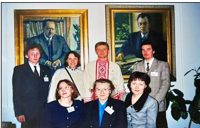
Косму тӧлысь 1997-ӧд во. IFUSCO конференцияӧ пырӧдчысьяс (Турку, Фин му).

кодыр фин-угор кывъясын, литература да фольклорын быдсяма мытшбдъяс.