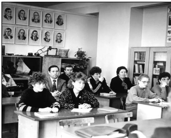
1994-ӧд во, Сыктывкар. Студентѣяслӧн быдвося конференция дырйи.

Студентѣяслӧн абу велӧдчан кадея туялан уджыс петкӧдчӧ быдсяма да уна удж формаын. Тайӧ и институтса (войдӧр — факультетса) быдвося студентѣяскостса конференцияяс, а сідзжӧ суйӧрсайса, ставроссияса, регионпытшса конференцияяс да симпозиумѣяс, тайӧ и быдвося предметнӧй олимпиадаяс, быдсяма конкурсьяс (шуам, вуджӧдчысьяс конкурс), кружокѣяс, тематическӧй рытѣяс (Суоми мулӧн ашӧрлун, Калевала лун, Чужан кывѣяс лун да с. в.), творчества йӧзкӧд паныдасьлӧмѣяс, фольклор да диалектология экспедицияяс серти кывкӧрталан рытѣяс да уна мукӧдтор.