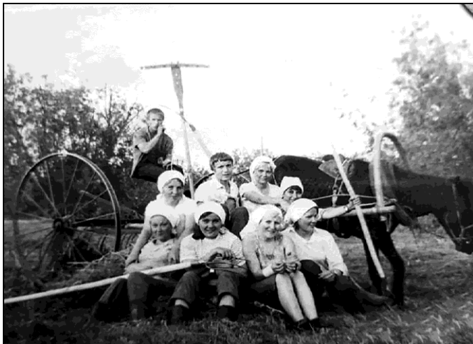
Кужим и велӧдчыны, и уджавны.

гырысь йӧзлы уна-уна сикас передачаяс. Ӧні уджыс мунӧ «Коми Гор»-ын РОССИИЯ-1 телеканалын «Ас му вылын» да «Финно-угорский мир» петкӧдчӧмъясын.