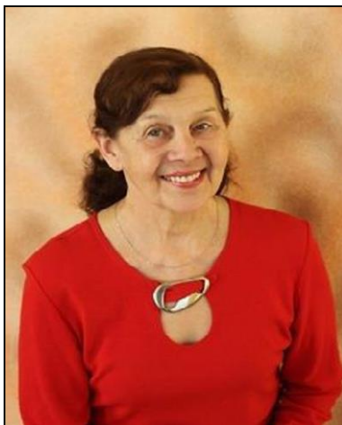
Р. И. Вагнер.