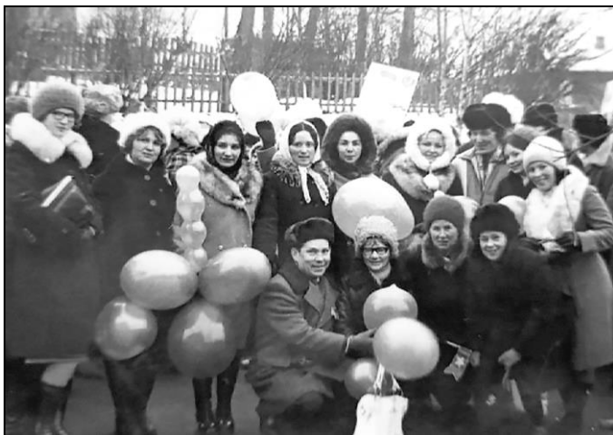
Велодысьяс да студентъяс ноябр 7-дд лунся парад дырйи.