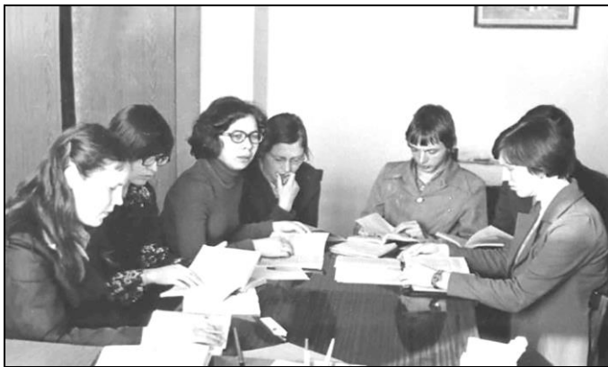
4 курс. Велöдам венгр кыв. Фотоыс Е. А. Цыланов архивысь

Нечаевыс Таганрогса пединститутын нин. Висьталіс, мый важ коми синтаксисö зэв унатор содöма роч кывйысь, юöртис, Кыдзи тэнö шуöны? юалöмыс пö важолысьяс пöвстын немся абу бергавлöма, сы пыдди шулöмны Мый нö тэнад нимыд? Кыдзи нимыд? Вайöдаліс öткодялана кывтэчасьяс да сёрникузяяс, öткодяліс удмурт да роч кывкöд.