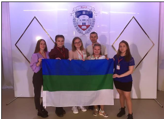
Май тѡлысѣ 2022-ѡд во. Йѡшкар-Олаын (Марий-Эл) «Богатство финно-угорских народов» войтыркостса форумѡ пырѡдчысыяс.

Докладьяс подув вылын студентьяслѡн эм позянлун йѡзѡдны ас туялѡмьясысѣ дженьыдик юѡрьяс тезисьясын да статтясын.