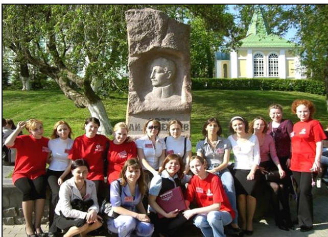
Май тӧлысь 2007-ӧд во. IFUSCO конференция дырйи Саранск карын (Мордовия).

Бӧрынджык IFUSCO выльӧ петавлісны ыджыдджык котырӧн, весиг 20-30 мортӧдз. Сэні найӧ, мукӧд муысь том войтыр моз жӧ, петкӧдчысны асланыс наука докладъясьӧн, сёрнитісны коми кыв, литература да фольклорын майшӧдлана, ӧнія кадлы актуальнӧй темаяс серти. Быд секцияын докладӧн сёрнитӧмысь миян студентъяс тшӧкыда вӧліны призёръясьӧн, тайӧ петкӧдлӧ кафедраыслысь велӧдӧмын тшупӧдсӧ, студентъяслысь туялӧмын водзмӧстчӧмнысӧ да зільӧмнысӧ, выльтор аддзыны да донъявны кужӧмнысӧ.