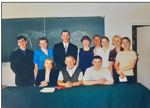
Квалификация уджъяс дорйӧм бӧрын. 2002-ӧд во.

Дерт жӧ, студентъяслӧн наука ашӧр удж медводз тыдовтчӧ курсывса уджъясысь. Вочасӧн найӧ кыпӧдӧны ассыныс тӧдӧмлунъяснысӧ, сӧвмӧны-быдмӧны, зильӧны петкӧдчыны наука быдсяма уджын. Университет помалӧгкежлӧ дасьтӧны наукабн тырвыйӧа подулалӧм диплом удж.