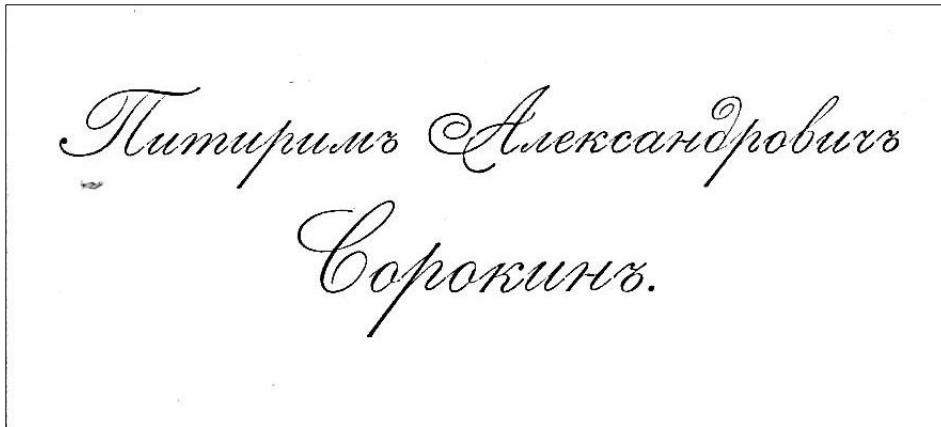
ГАРФ. Фонд 601. Оп. 1. Дело 52. Лист 7.

Отдельный интерес в этом фонде представляет дело № 52, «Визитные карточки разных лиц, адресованные Сорокину П.А.». Наряду с визитными карточками его коллег и учителей, в нем представлены личные визитные карточки самого Питирима Сорокина, отражающие разные этапы его профессиональной и политической деятельности.