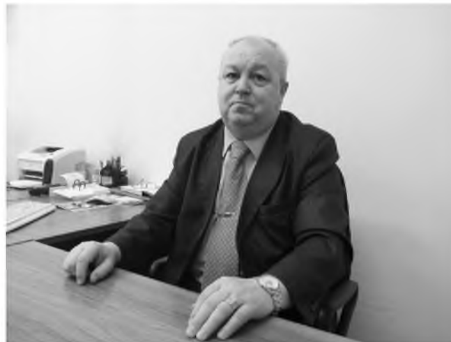
вода войск, всегда приходим к памятнику 15 февраля. Мы же делали одно общее дело.

Какое может быть отношение к ветеранам Афганистана? Только уважительное. Мы вместе отмечаем день вы-