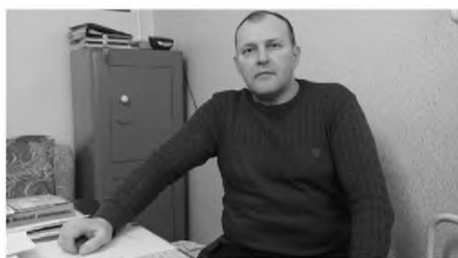
ми, как и мы. Государство сказало, куда направить войска, и мы отправились. Разница только в том, что мы выполняли воинский долг в пределах России, а они — за пределами страны.

Ветераны Афганистана были такими же подчинёнными