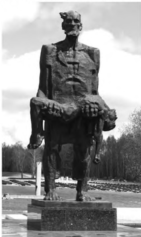
Мемориал в Хатыни

Так откуда же такая разница? Почему Беларуси удаётся не просто сохранять баланс между двумя сильнейшими религиозными группами (католицизм и православие) и менталитетами, но ещё и укреплять их взаимоотношения? Чтобы ответить на этот вопрос достаточно вспомнить тех, кто прячется за лозунгами о национальной идентичности и мнит себя заступниками искусственно созданного этноса. Украинские националисты, бандеровцы, УНА УНСО, УПА, ОУН, Правый сектор, Тризуб, Спильна Справа (СС)... Имен много, суть одна. Какие-то из них исчезли, какие-то сейчас распевают песни «...кто не скачет, тот москаль...», требуют крови, стоя на площадях родины Русского Государства.