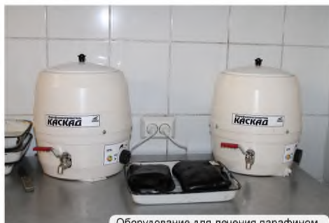
Оборудование для лечения парафином