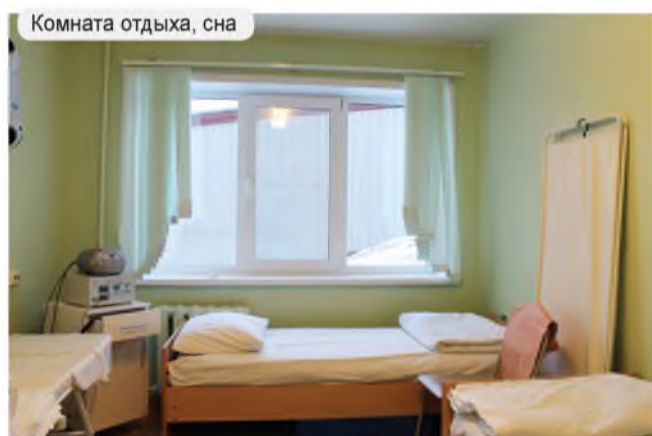
Комната отдыха, сна