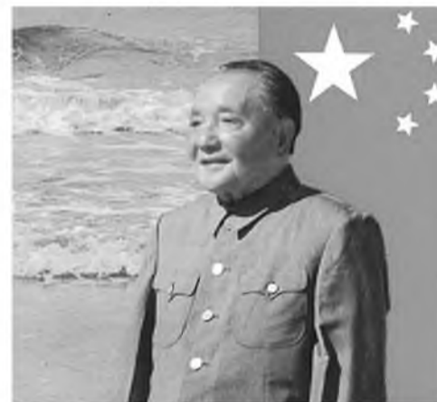
Дэн Сяопин, китайский политик и реформатор, деятель Коммунистической партии Китая, родился 22 августа 1904 года.

Как бы то ни было, Китай не может изолироваться подобно США, отгородив себя океаном, в виду географических особен-