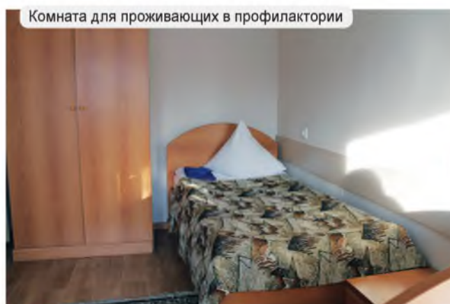
Комната для проживающих в профилактории