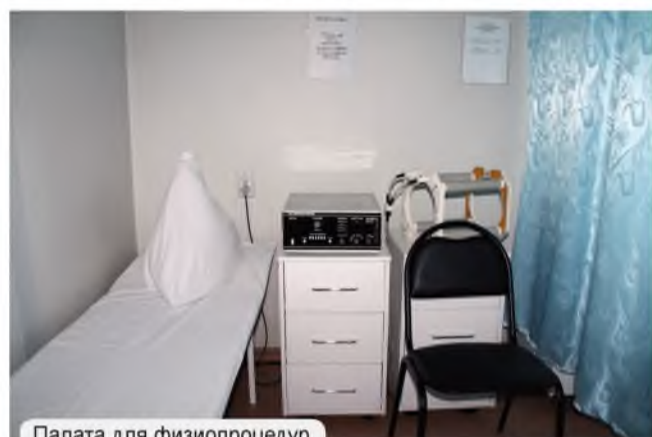
Палата для физиопроцедур